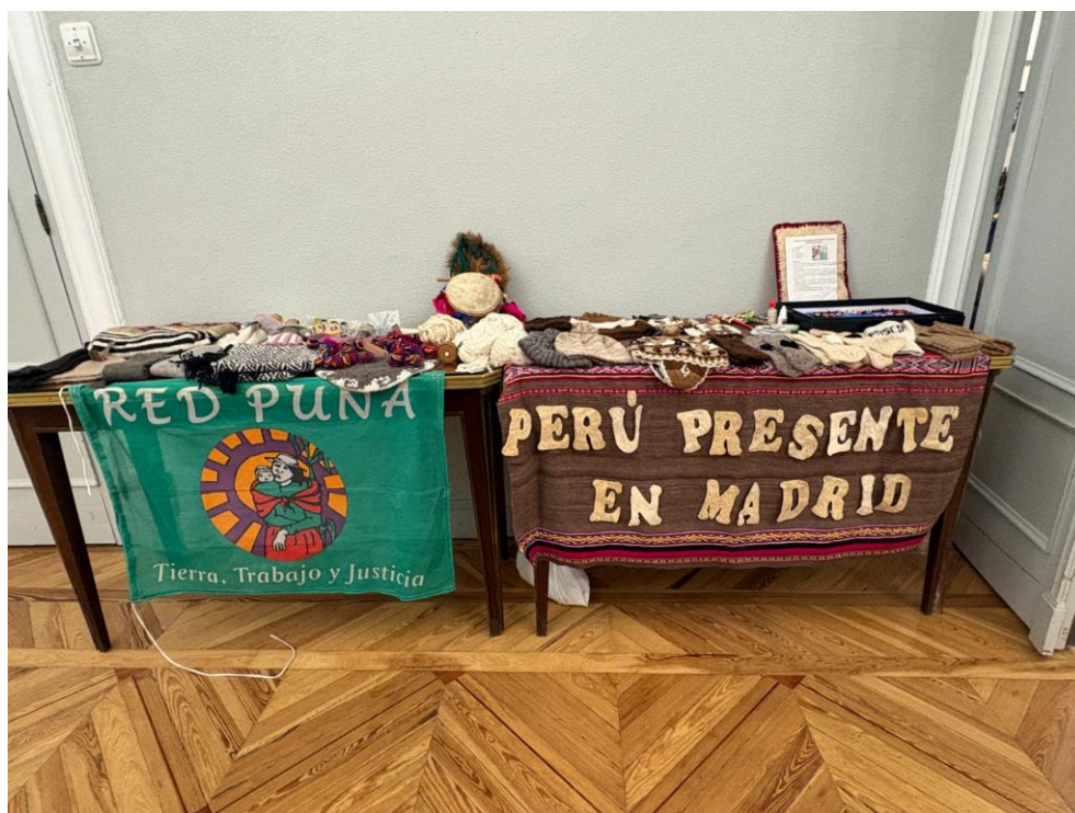
Madrid, 9 April 2026. Shepherdesses from the Andes brought objects of sheep wool (left - Argentina) and Alpaca wool (right - Peru), they had woven themselves