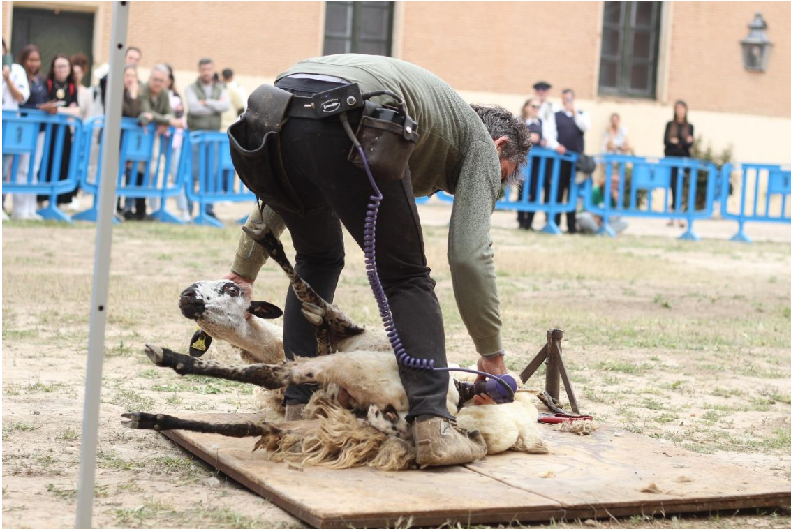
Aranjuez, 11 April 2026: Demonstration of sheep sheering