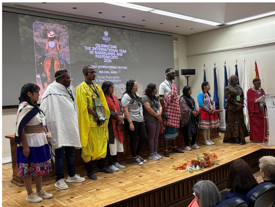
Madrid, 9 April 2026. Speech of the Coordinator of IYRP Young Pastoralists Working Group, who invited the young pastoralists to join