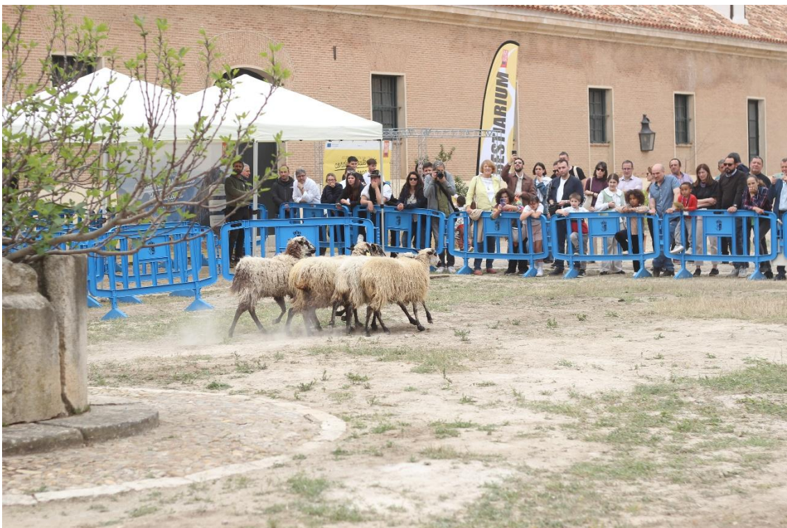
Aranjuez, 11 April 2026: Demonstration of dogs herding livestock