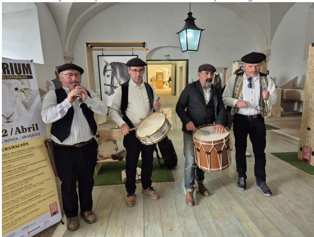
Aranjuez, 11 April 2026: musicians with a repertoire of traditional popular songs, playing simple instruments (the flute, the tambourine, the drum and triangle) at festivals. In the room was the exposition of Bestiarium: Big pictures of all native breeds of Spain (horses, cows, sheep, goats, dogs, chicken, pork and turkeys) used by pastoralists (also during transhumance)