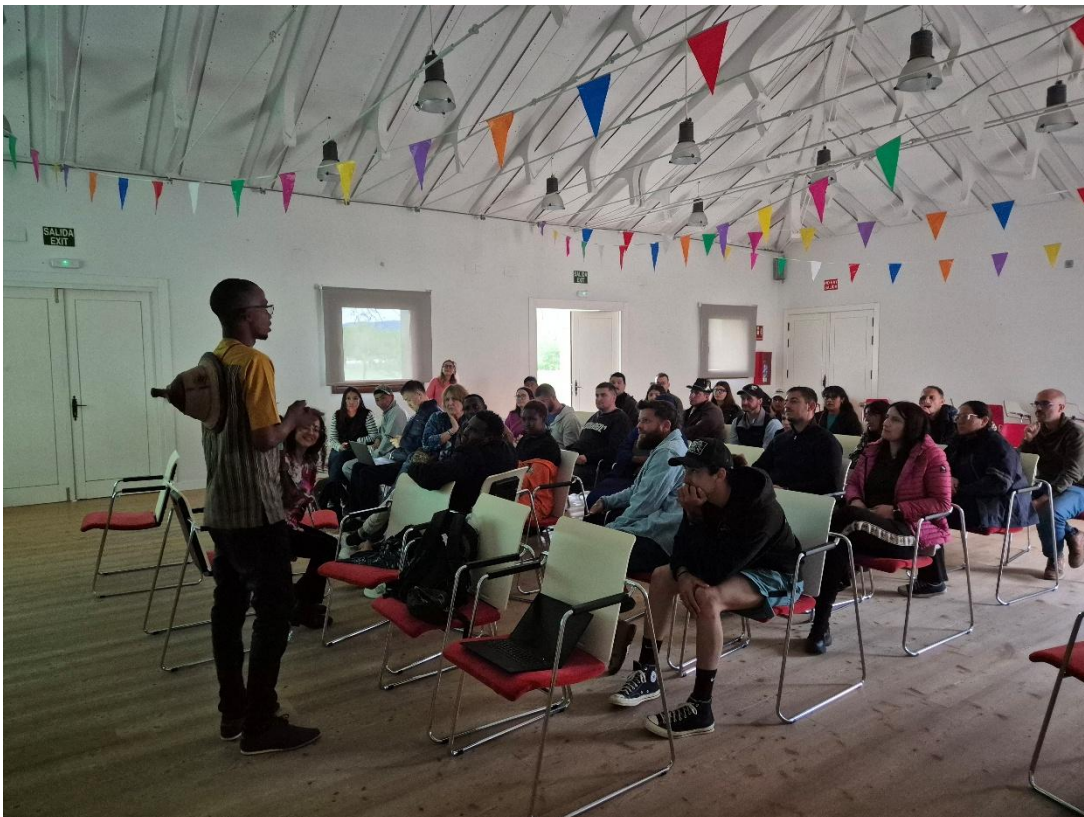
Soto de Henares 08-04-2026. All young pastoralists who arrived the 8 th of April have been working in the different languages, finetuning all together the final declaration, that had already been prepared for weeks before the event