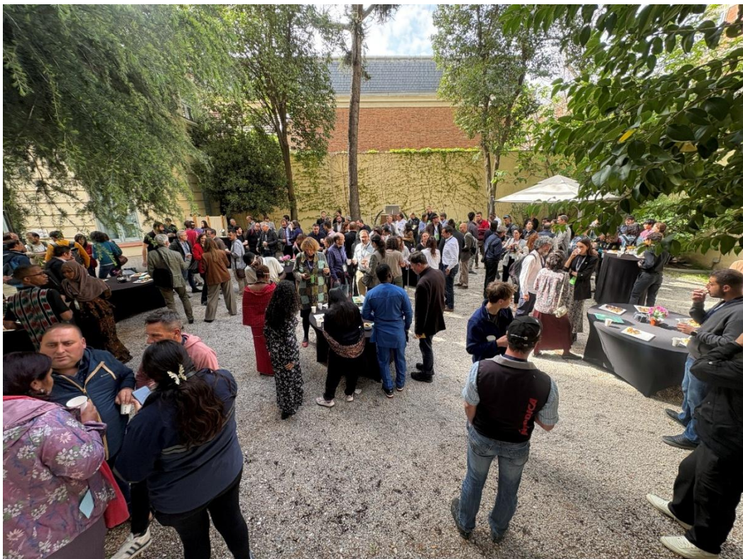
Madrid, 9 April 2026: Coffea breaks in the garden of Spanish Institute of Engineers, during the event