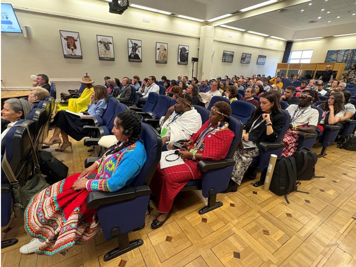
Madrid, 9 April 2026: during the event 200 persons were attending in presence and 200 in remote